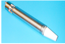
Figure 2 : tube neutronique Sodern (diamètre 36 mm)

Deux fonctionnalités extrêmement importantes pour l'utilisation des tubes neutroniques dans les applications d'analyse peuvent être utilisées :