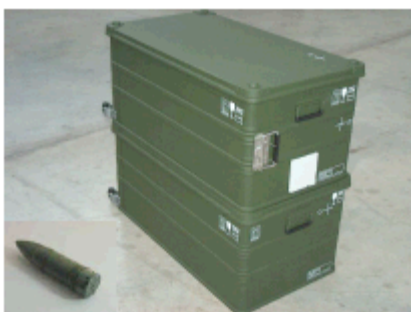
Figure 4 : les modules d'émission et de détection du NIPPS (et un objet en bas à droite)

Dans le domaine de la sécurité, les premiers travaux ont concerné les armes chimiques, la technologie neutronique étant la seule capable de résoudre le problème de l'identification d'un composé chimique dans une munition étanche. Cette application résulte des besoins d'identification des vieilles munitions datant de la première guerre mondiale que l'on retrouve au fil du temps dans le Nord Est de la France (et ailleurs : Belgique, Angleterre, Etats-Unis, Chine, Japon, ...) et des besoins de contrôle faisant suite au traité signé par 183 pays ayant trait à l'interdiction de la fabrication d'armes chimiques. Dans ce cadre, Sodern a récemment livré à l'OPCW (Organisation for the Prohibition of Chemical Weapons) un instrument d'expertise baptisé NIPPS (Neutron-Induced Prompt Photon Spectrometer) permettant l'analyse de munitions. Cet équipement est basé sur l'utilisation d'un tube « DD » (c'est-à-dire sans tritium), émettant environ 2 \cdot 10^7 neutrons de 2.45 MeV par seconde et d'un détecteur unique de type HPGe (Germanium). Les 2 caisses de transport contenant les modules de détection et d'émission sont représentés en figure 4. Il n'est pas nécessaire de sortir les matériels qui peuvent être utilisés en restant dans leur caisse.